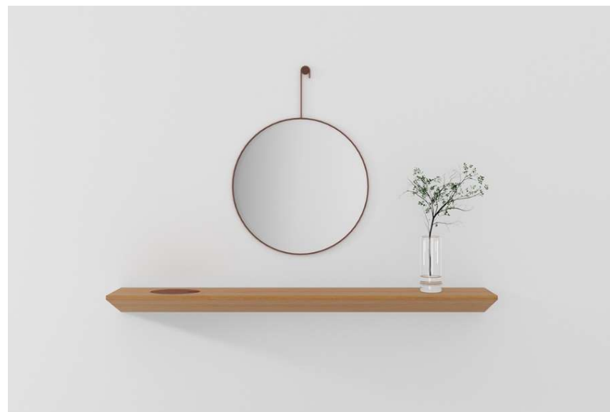
Medidas: L 0,55 x P 0,03 x A 0,75 m | L 0,80 x P 0,03 x A 1,01 m

E para completar os detalhes daquele quarto único, o Espelho Olho é um coringa super elegante. A peça é feita em duas versões de tamanho para uma perfeita adaptação ao projeto.