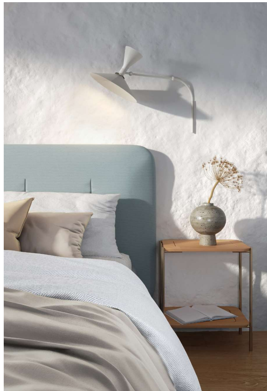
MESA DE CABECEIRA GABIE II