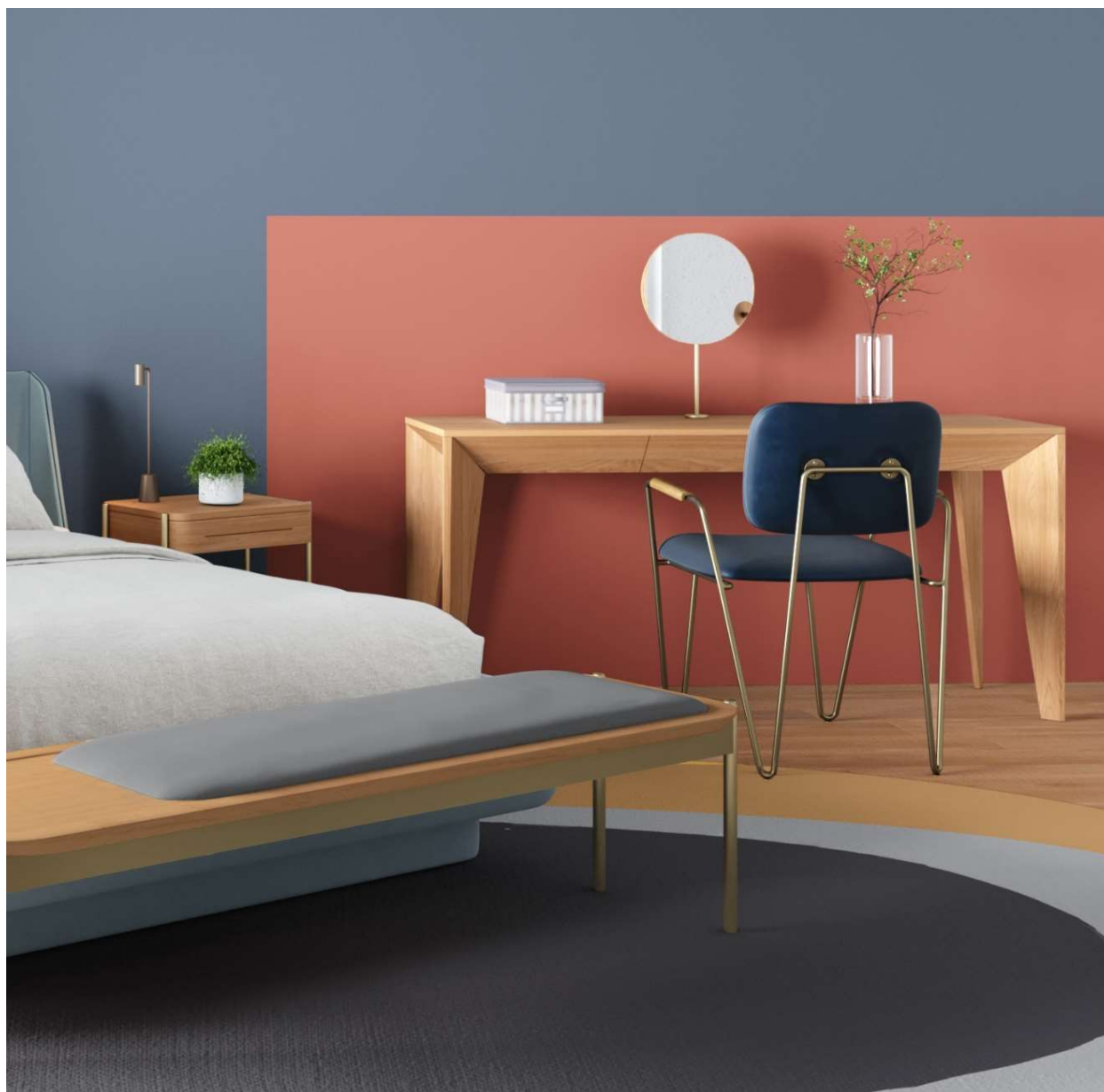
Medidas: Penteadeira com espelho L 1,50 x P 0,50 x A 1,25 m