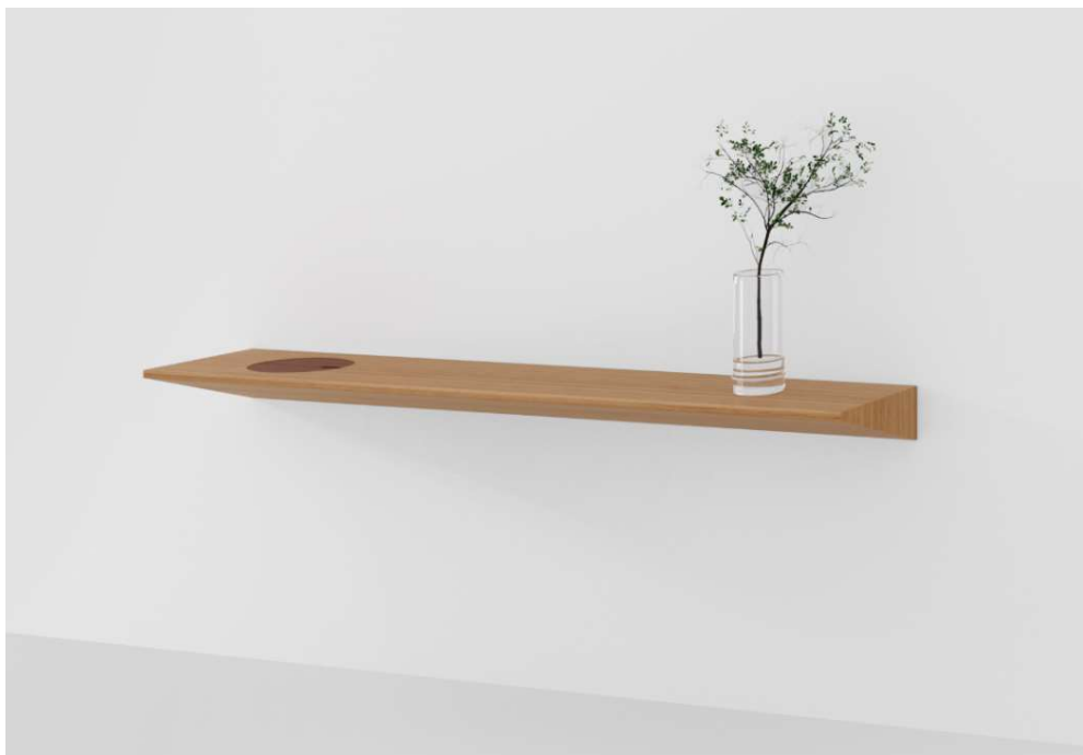
Medidas: L 1,00 / 1,20 / 1,50 x P 0,30 x A 0,10 m

O aparador Vértice é inspirado em Madeleine Vionnet, estilista francesa considerada a inventora do corte enviesado. Ela trabalhava com peças inteiras de tecidos e complicadas costuras para tirar todo o volume dos vestidos, fazendo que tivesse um caimento perfeito. Criativa e com visão de negócios e liderança, sua empresa chegou a empregar 1200 pessoas, onde ela providenciava para que os aprendizes recebessem educação e garantia assistência médica gratuita aos seus funcionários e às famílias. Ao longo da década de 30 sua importância cresceu, e seus vestidos enviesados passaram a ser cobiçados e muito imitados