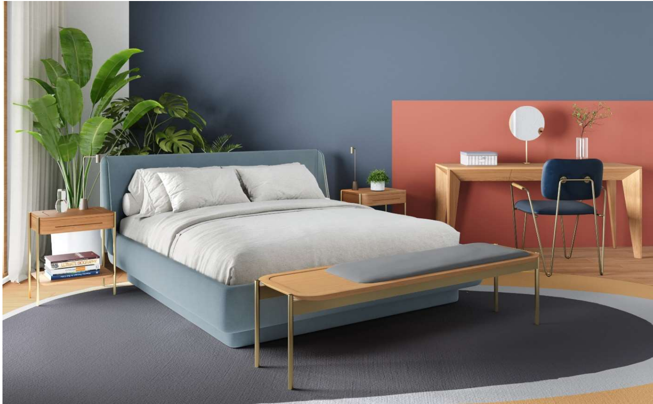
L 1,00 / 1,50 x P 0,45 x A 0,45 m