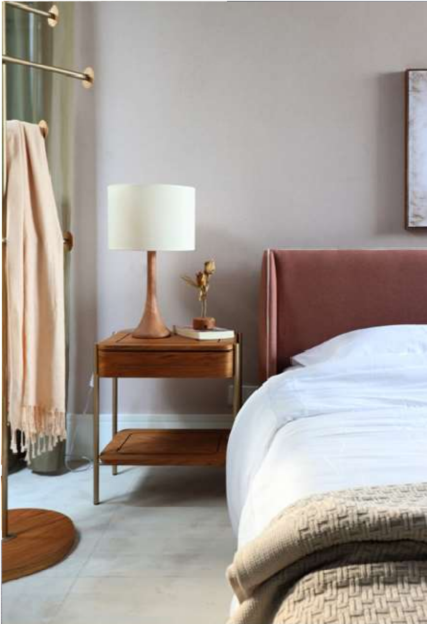
Medidas: L 0,49 x P 0,35 x A 0,55 m