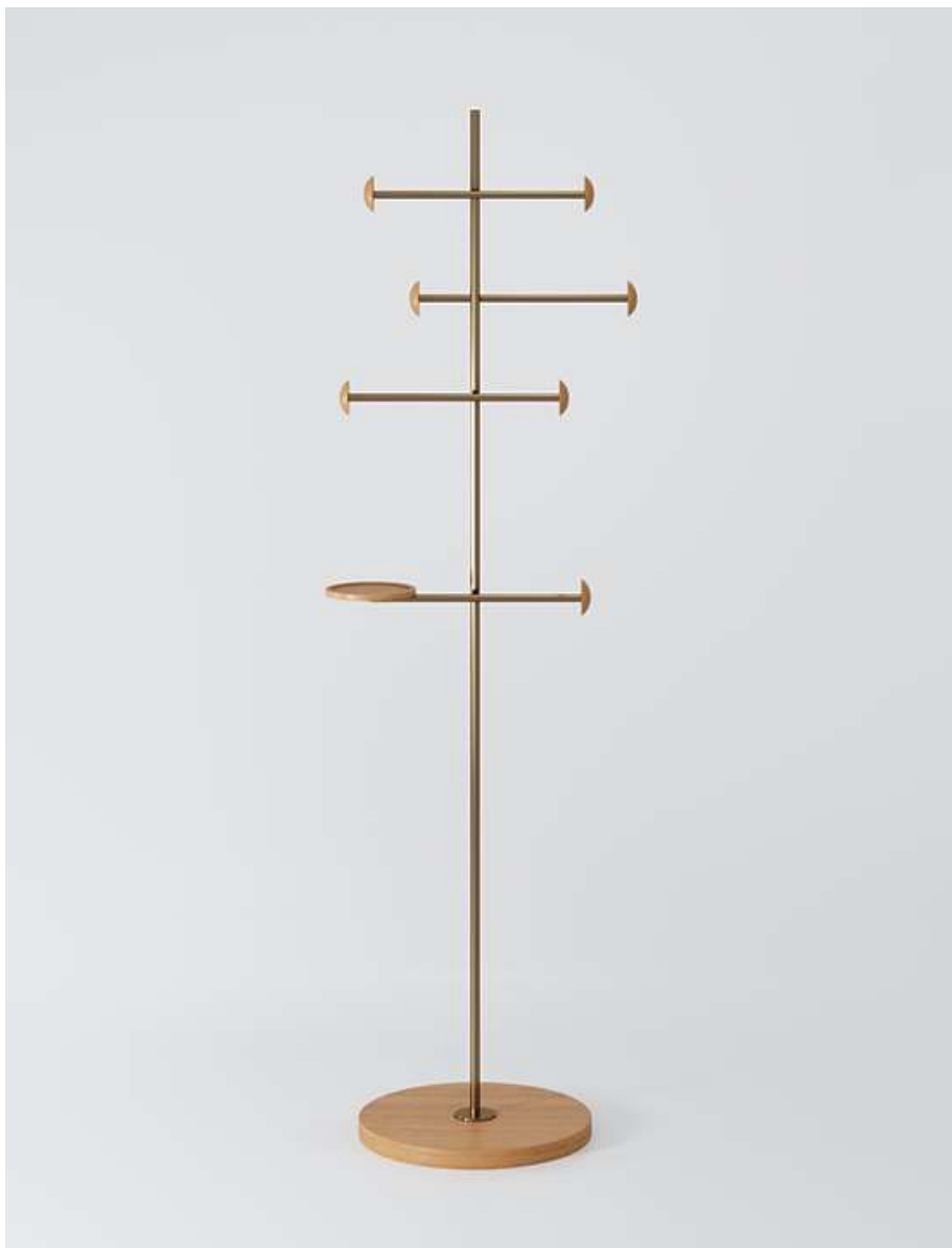
Medidas: L 0,55 x P 0,40 x A 1,70 m