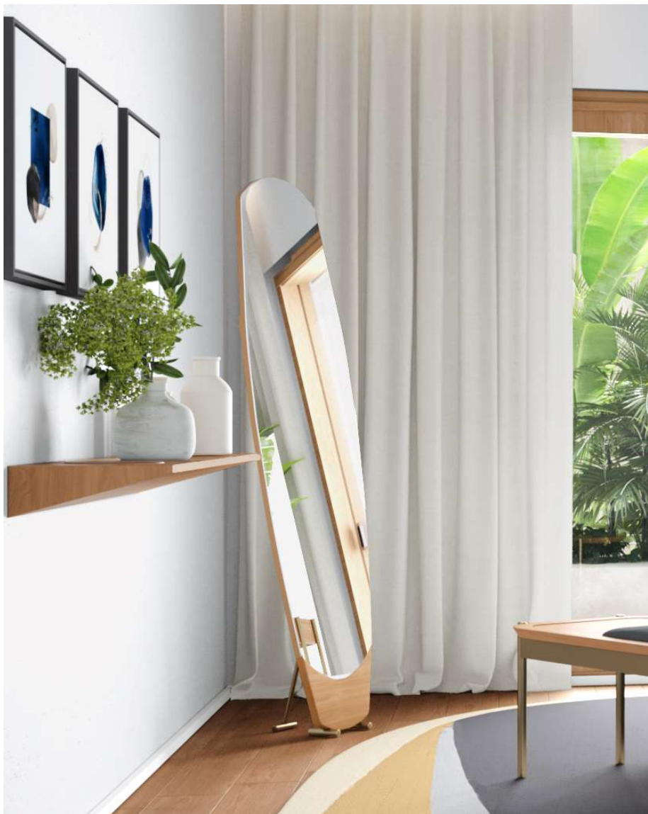
Medidas: L 0,55 x P 0,26 x A 1,75 m